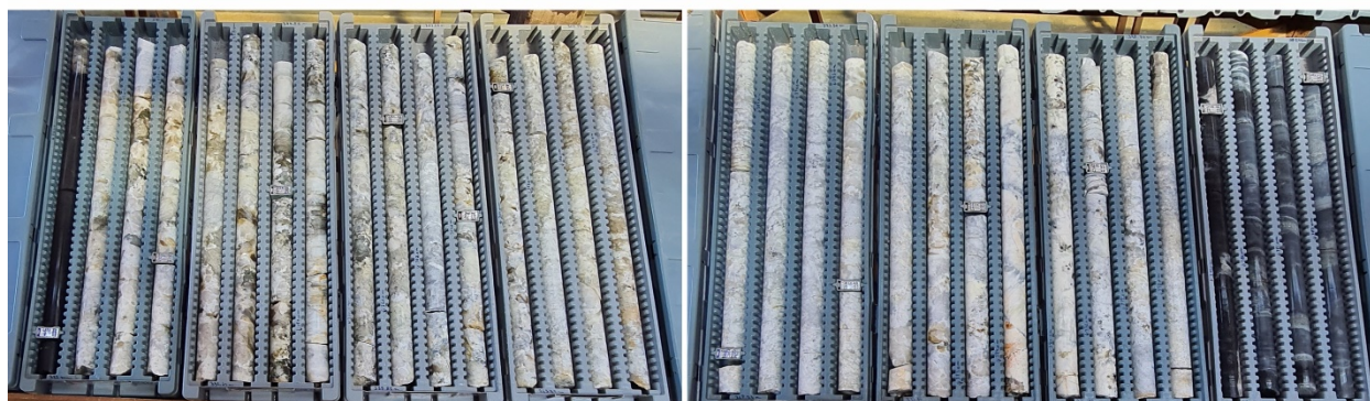
Abbildung 3: Foto des Kerns aus Bohrloch ITDD-23-065 von Abschnitt LT700

1.32% Li 2 O over 24m, incl. 2.12% Li 2 O over 8m from 354.2m to 378.2m